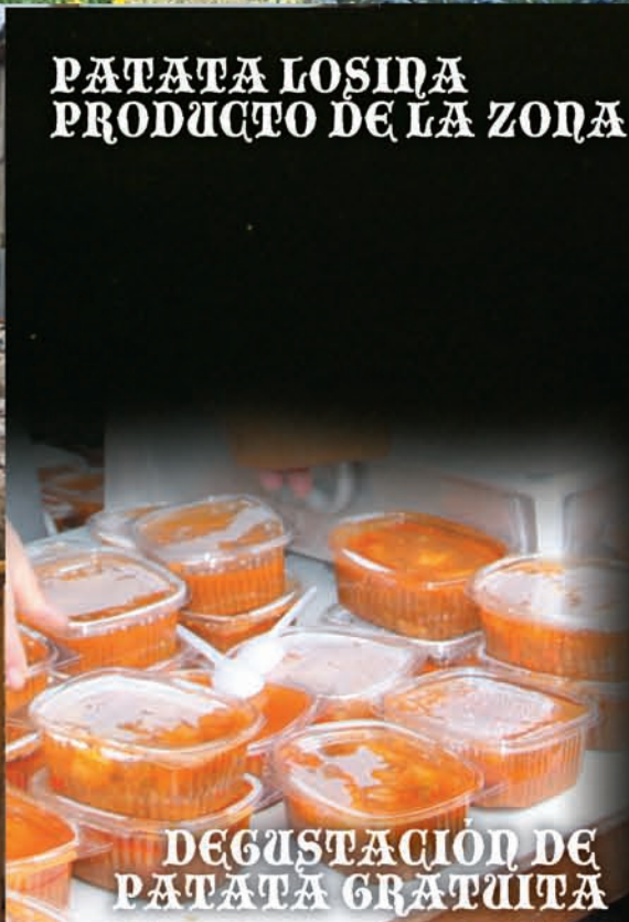
DEGUSTACION DE PATATA GRATUITA