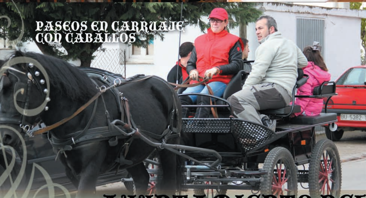
PASEOS EN CARRUAJE CON CABALLOS